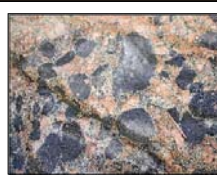
ENXAMES DE ENCRAVES