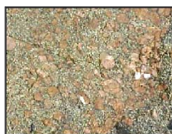
ENXAMES DE MEGACRISTAIS