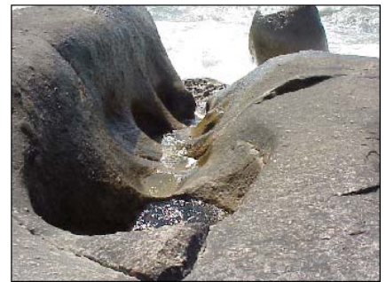
MARMITA LITORAL + CANAL ESCOAMENTO